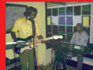
Men from Paradise